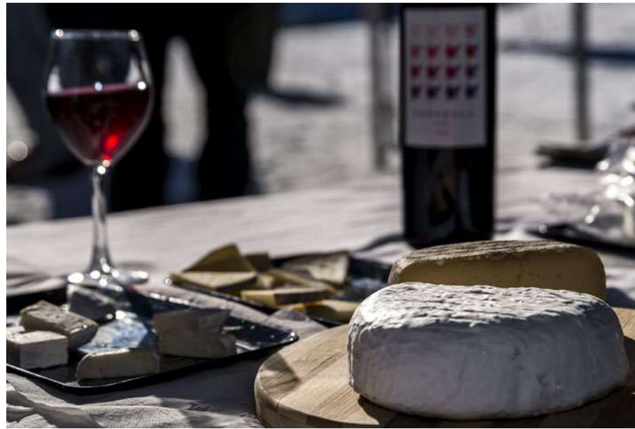
Felipe Valladares ©FGC