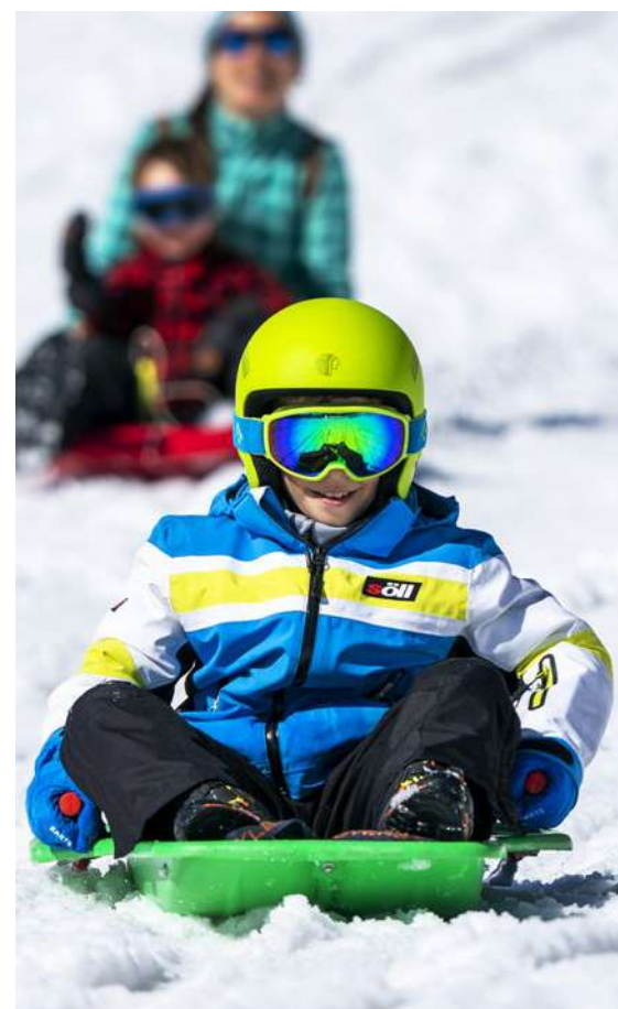
Ofel Molas ©FCC