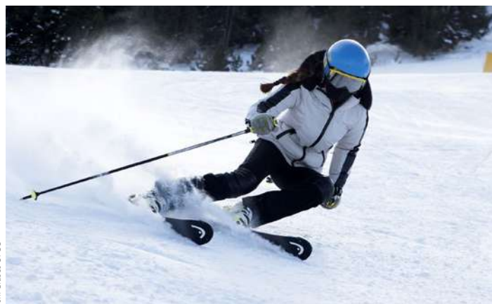
Tom Grasas ©FCC