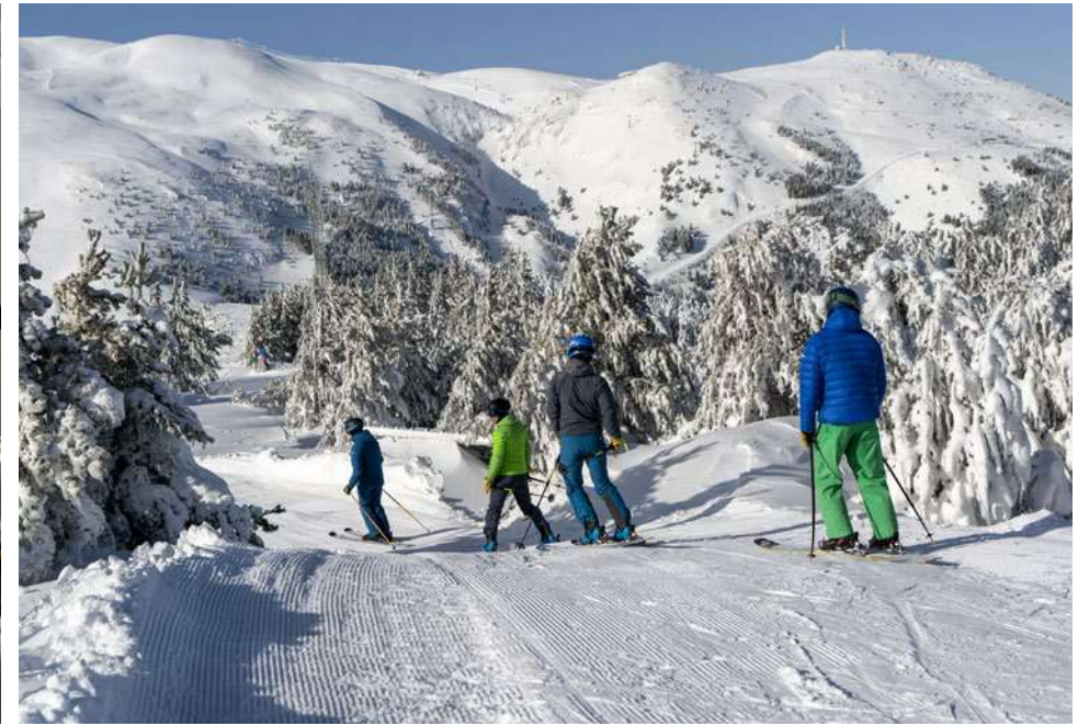
Oriol Molas FCC