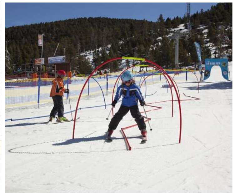
Felipe Valladares ©FGC