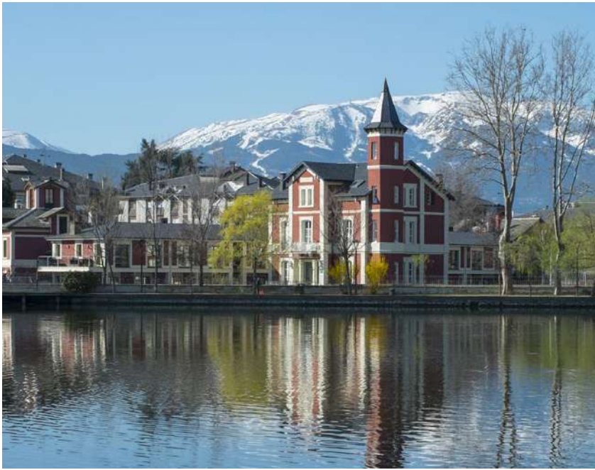
Inmedia Solutions ©ACT